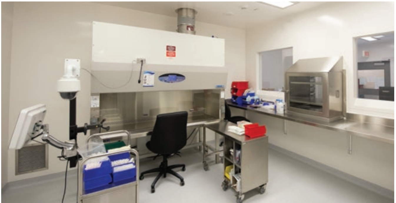
Salle de préparation stérile de médicaments d'oncologie.

1. MSSS. (2013). Répertoire des guides de planification immobilière : Aires réservées aux préparations stériles (Unité de pharmacie) , Publications du Québec.