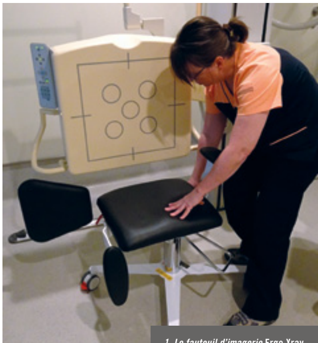
1. Le fauteuil d'imagerie Ergo Xray .

Lors des examens devant le bucky mural, le client s'assoit sur un banc de bois sans dossier ou sur un petit tabouret à roulettes et assise mobile. Si le client est instable ou s'il a besoin d'assistance, il risque de chuter.