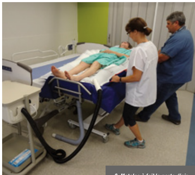
2. Matelas à faible perte d'air.

Pour des graphies de la colonne vertébrale ou des poumons, le technologue bascule le dossier latéralement, ce qui sécurise le client au moment de son installation sur la chaise et dégage le dossier pour la graphie. Les appuie-bras tronqués sont aussi basculés au besoin. La hauteur du fauteuil s'ajuste au moyen d'une pédale hydraulique.