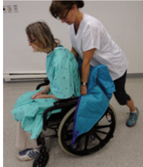
4. Toile bleue à revêtement glissant et toile avec une structure rigide.

Un levier mobile au sol n'est pas une option intéressante en imagerie, surtout si la table d'examen possède une base pleine empêchant le passage du levier. Le levier sur rail au plafond est à privilégier et les rails en forme de H offrent plus de polyvalence ( photo 3 ).