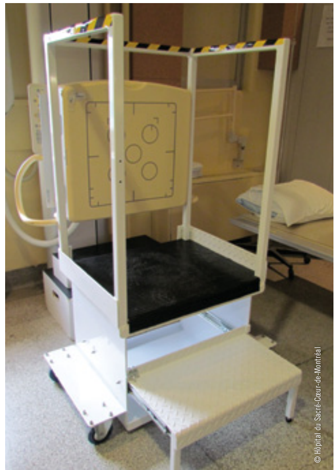
6. L'Hôpital du Sacré-Cœur-de-Montréal a commandé un marchepied qui a été fabriqué sur mesure en fonction des besoins émis par les technologues en radiologie.

* Détails techniques sur Internet (asstsas.qc.ca/op404019).