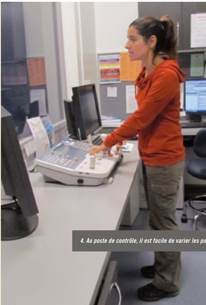
4. Au poste de contrôle, il est facile de varier les positions de travail.

L'équipe du Service d'imagerie médicale de l'Hôpital Brome-Missisquoi-Perkins du CIUSSS de l'Estrie-CHUS prend la SST à cœur. Elle poursuit son engagement de réduire les accidents dans le milieu. Félicitations ! ■