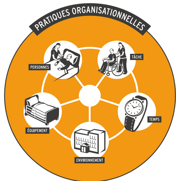
Approche globale de la situation de travail

au coût des accidents du travail et au potentiel d'économie. En effet, la formation en classe n'agit que sur le travailleur pour modifier ses compétences ; elle n'élimine pas les dangers provenant des autres éléments de la situation de travail 2 . Avec une préventionniste préposée aux bénéficiaires (PAB), formatrice PDSB et Approche relationnelle de soins (ARS), nous avons donné de la formation aux employés avec leurs propres résidents, directement dans le milieu de travail.